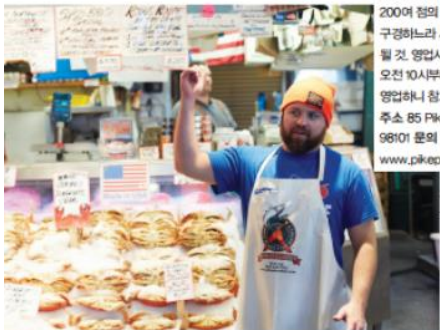
시애틀의 핫 스팟, 파이프 플레이스 마켓.

주소 85 Pike St., Seattle, WA 98101 문의 206-682-7453, www.pikeplacemarket.org